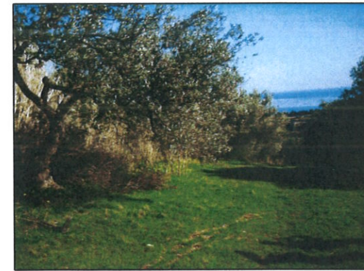
Fotografia n° 06