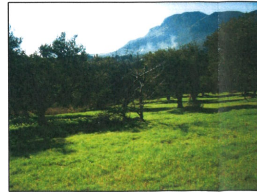
Fotografia n° 07