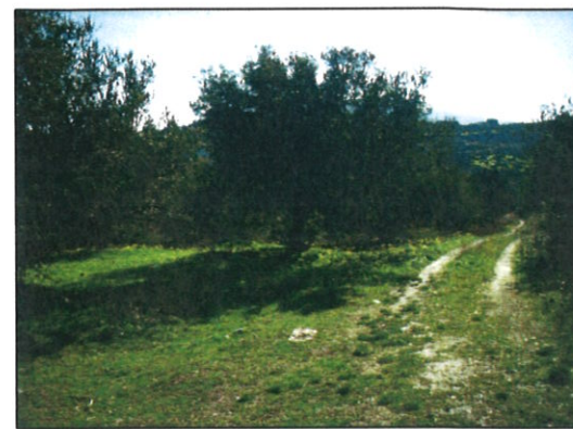
Fotografia n° 02