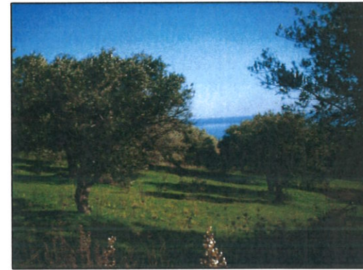
Fotografia n° 04