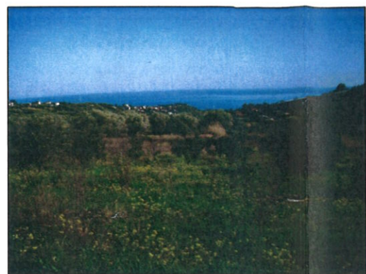
Fotografia n° 01