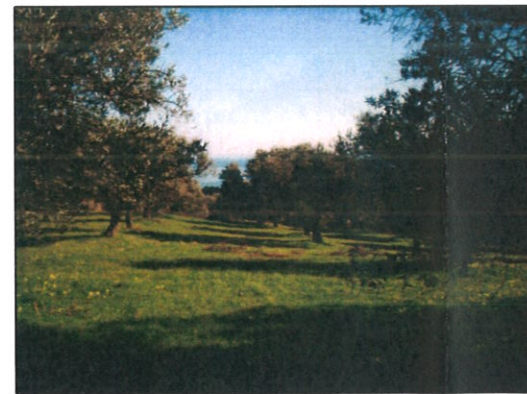
Fotografia n° 05