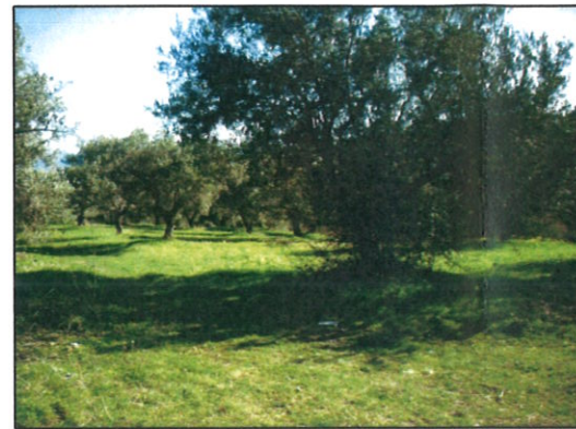
Fotografia n° 03