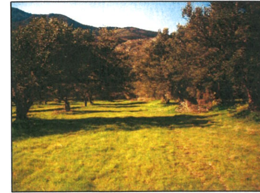
Fotografia n° 08